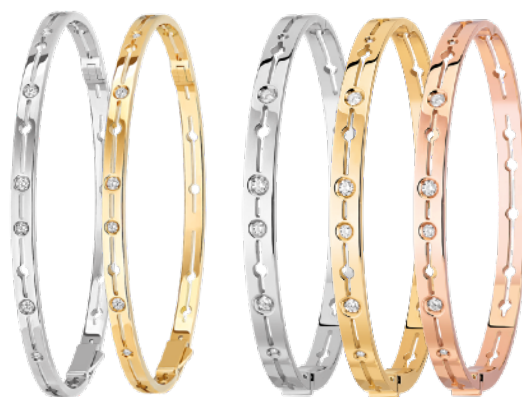
Van links naar rechts - Pulse klein model armband in witgoud en diamant (€5 050) - Pulse klein model armband in geelgoud en diamant (€4 800) - Pulse armband in witgoud en diamant (€7 900) - Pulse armband in geelgoud en diamant (€7 900) Pulse armband in roze goud en diamanten (€ 7 550).

(11) Pulse armband, klein model, in geelgoud en diamant (€4 800) - Pulse armband, klein model armband in witgoud en diamant (€5 050) - Pulse armband in geelgoud en diamant (€7 550). (12) Het model draagt een Pulse oorclip in geelgoud en diamanten (€ 1 590).