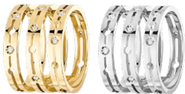
3-rijige Pulse ring in geelgoud en diamant (€3 400) 3-rijige Pulse ring in witgoud en diamanten (€3 570).

Sinds 2017 biedt de Pulse-collectie een reeks functies, waaronder ringen, armbanden, oorbellen clips... voor hem en voor haar. Een collectie met veelzijdigheid, vergroot door de schittering van diamanten bewerkt in harmonie, als een kostbare puls.