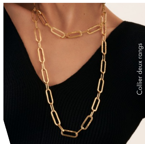
Collier deux rangs