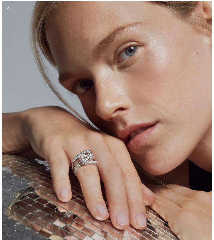
7. Maillon ring Star, witgoud en diamanten.