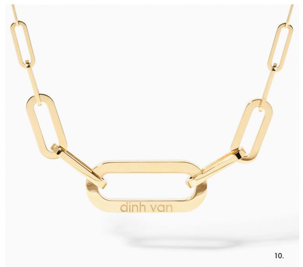
8. Maillon oorbellen, geelgoud en diamanten • Maillon halsketting met pavé-gezette inkepingen, geelgoud en diamanten • 9. Enkele Maillon oorbel, geelgoud en diamanten • 10. Maillon halsketting XL, geelgoud.