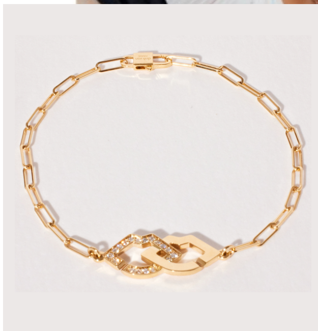
2 Lips armband geelgoud en diamanten met dinh van ketting S (1 650€).