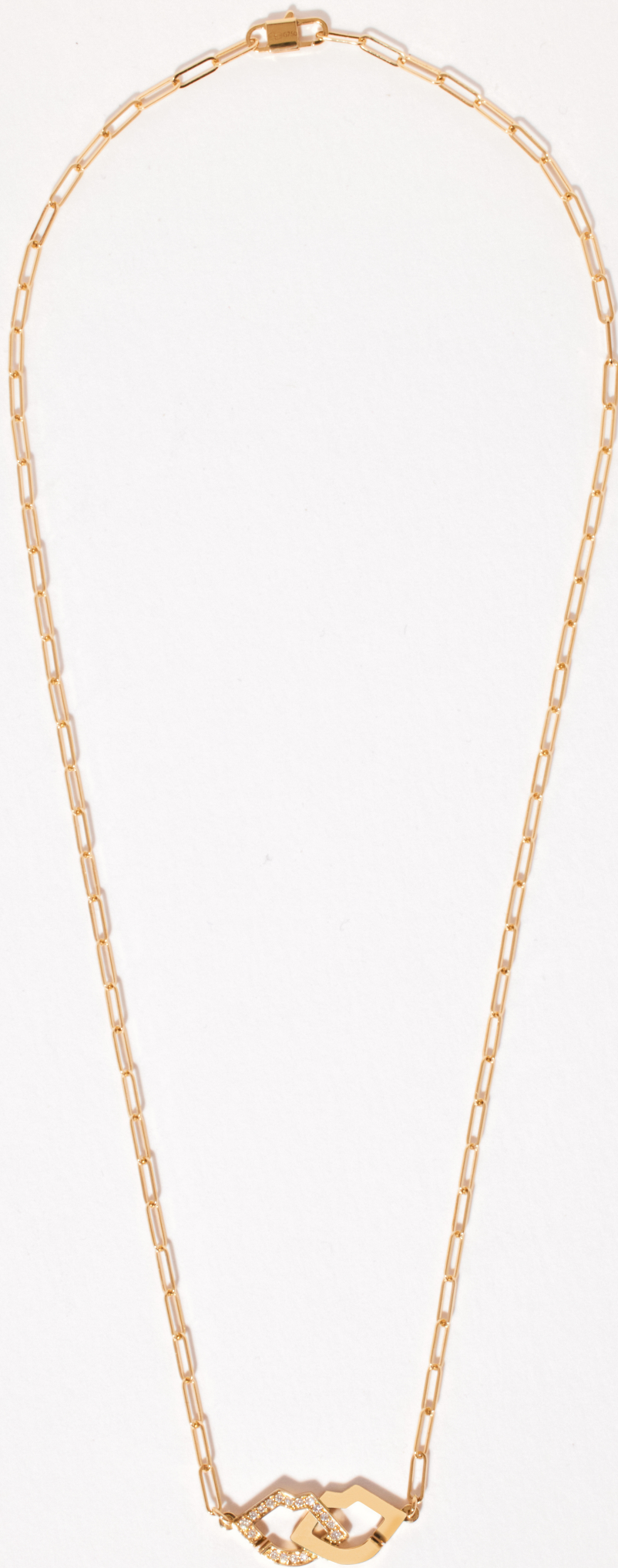
2 Lips collier in geelgoud en diamanten aan een ketting van Dinh van S (2 200€).