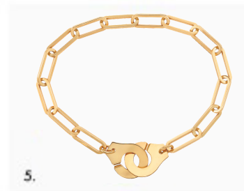
1. Ketting Menottes dinh van R13,5 in geelgoud en diamanten (9 500€) 2. Menottes dinh van ketting R13,5 in witgoud en diamanten (9 980€) 3. Ring Menottes dinh van R12 in geelgoud en diamant (3 850€) 4. Menottes dinh van R12 armband in geelgoud (€ 2.690) 5. Menottes dinh van R15 armband in geelgoud (€4.990).