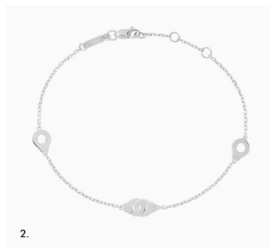
1. Collier Menottes dinh van R5, or jaune – 990€ • 2. Bracelet Menottes dinh van R5, or blanc – 990€ • 3. Bague chaîne Menottes dinh van R7, or jaune – 810€.