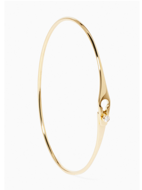
Bracelet Serrure Jonc, or jaune et diamant – 2.700€.