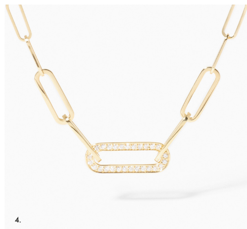
4. Collier Maillon petit modèle, or jaune et diamants – 2 990€ • 5. Bague Maillon petit modèle, or blanc et diamants – 2 110€ • 6. Bague Maillon petit modèle, or jaune et diamants – 1 990€.