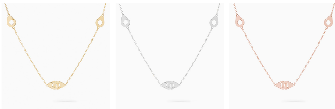
Menottes dinh van R5 halssnoeren, met forçat-ketting, in geel, wit of rosé goud – €950, €990, €950.

Met een iconoclastische inspiratiebron en moderne vormen staat de collectie Menottes van dinh symbool voor de onbreekbare band tussen twee wezens.