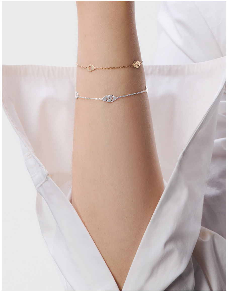
Menottes dinh van R5 armbanden, met forçat-ketting, in geel, wit of rosé goud –€840, €880, €840.