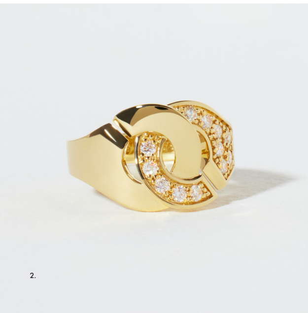
1. Menottes dinh van R16 ring, geelgoud – 3 990€ • 2. Menottes dinh van R12 ring, geelgoud en diamanten – 4 250€ • 3. Menottes dinh van R13,5 necklace, collier, geelgoud en diamanten – 11 450€ • 4. Menottes dinh van R13,5 collier, witgoud en diamanten – 12 140€ 5. Menottes dinh van R12 armband - 21 cm, platina – 3 820€ • 6. Menottes dinh van R12 armband - 21 cm, geelgoud – 3 530€

De Menottes dinh van, geïnspireerd op een sleutelhanger uit 1976, is de belichaming van de tijdloze, eigentijdse juwelen van het merk. De iconische collectie Menottes dinh van, die de eeuwige band tussen twee mensen symboliseert, is verkrijgbaar in geel of wit goud, al dan niet versierd, en staat voor een gedurfde elegantie met een resoluut eigentijds accent.