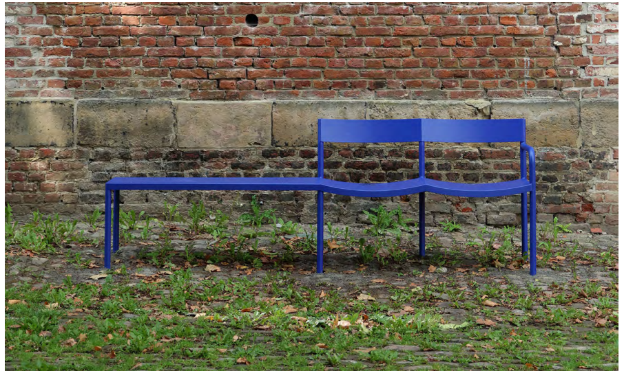
Cour ovale, 2024