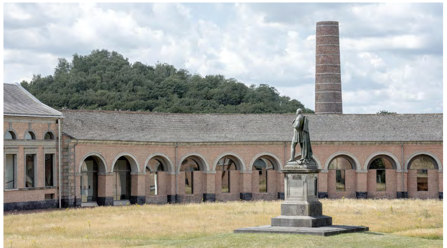
Cour carrée, 2024