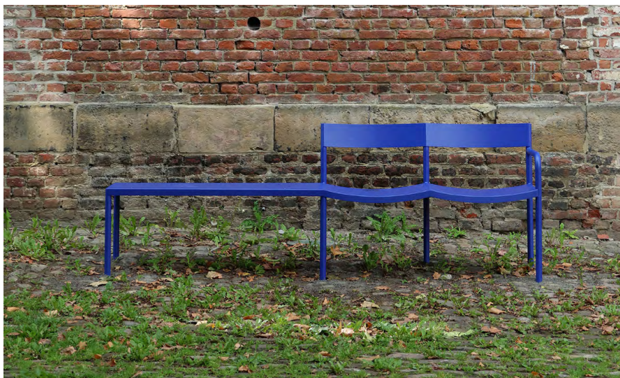
Cour ovale, 2024