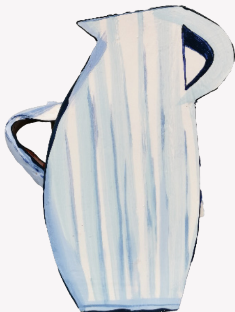
L'oeil d'égée - Earthenware, Engobes, Oxides, Lead-free glazes- 28x22x9cm - 2023