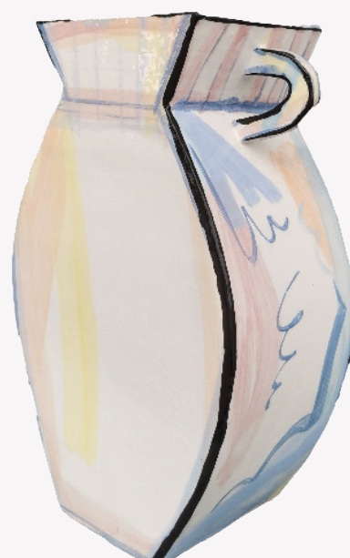
Le dodu - Faïence, Engobes, Oxydes, Emaux sans plomb - 32x22x11cm - 2023