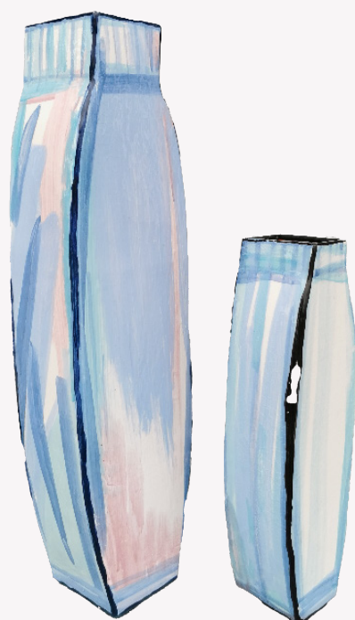
Le fils - Earthenware, Engobes, Oxides, Lead-free glazes - 49x13x9cm - 2023

Bauer put uit een gebied van visueel onderzoek dat nauw verbonden is met de geschiedenis van de kunst en het beeld.