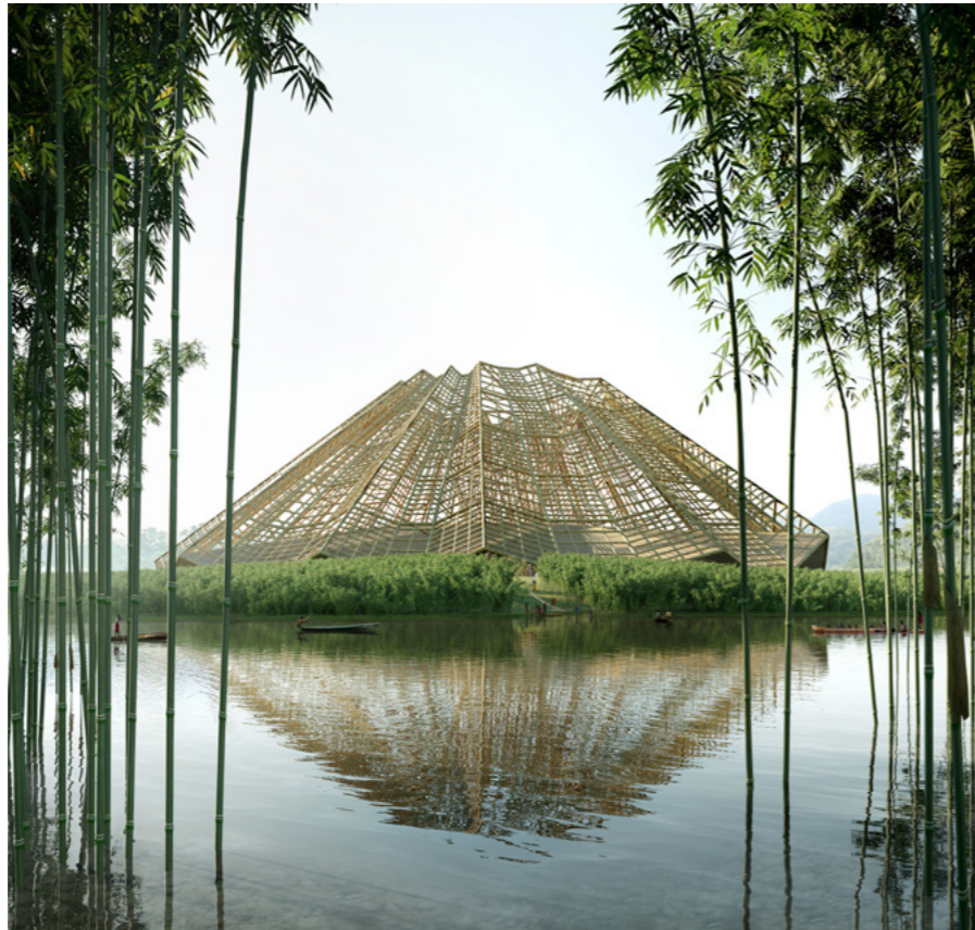
La Pista Arese, 2015