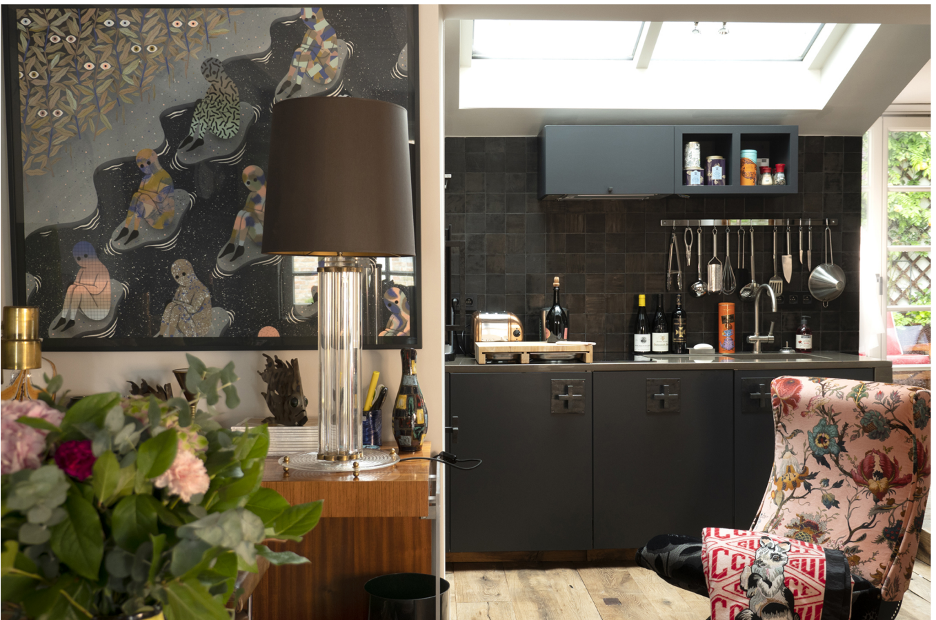
Tableau du tandem d'artistes peintres belges Hell'o. Bureau scandinave déniché sur 1 st dibs.