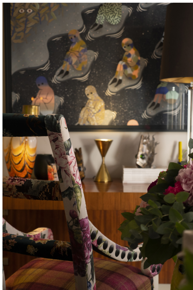
Bureau scandinave 1st dibs, lampe italienne dénichée à la Fiera di Parma.

Dans cette maison, il apprécie particulièrement les petits fantômes représentés dans leur œuvre murale ainsi que son canapé italien recouvert de tissus façon "Coronation Street", une série télévisée à laquelle il était difficile d'échapper, à l'époque, en Angleterre .