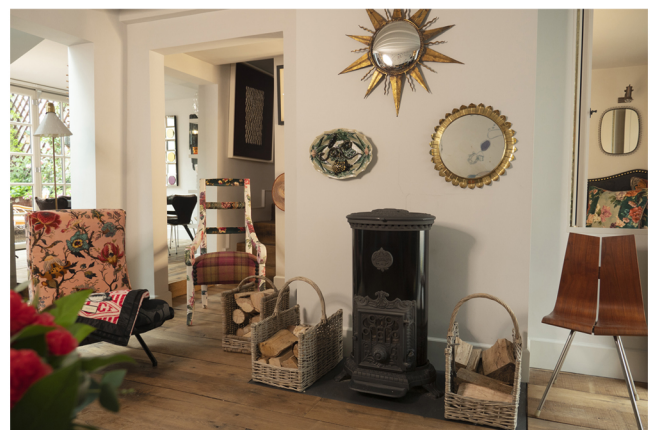
L'indispensable poêle Godin.

“travailler avec des artisans qui vous comprennent et que vous comprenez, c’est un bonheur inestimable” avance-t-il avec conviction. Le parfum dans une maison, c’est plus que le finishing touch pour parfaire une ambiance ».