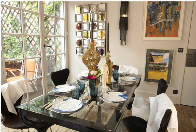
Table de salle à manger d'inspiration Carlo de Carli

Les contenants et les plateaux sur lesquels ils reposent sont pour lui des objets de décoration à part entière qui, cerise sur le gâteau, accueillent sa passion: les parfums d'ambiance.