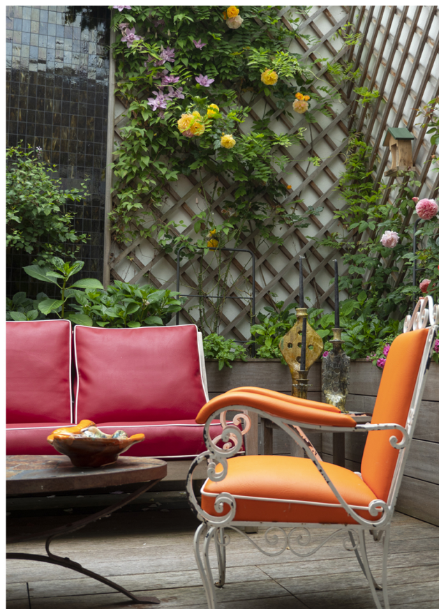
Fauteuil en fer forgé des années 60, table en fer forgé chinée à la foire de Deulin en Belgique.