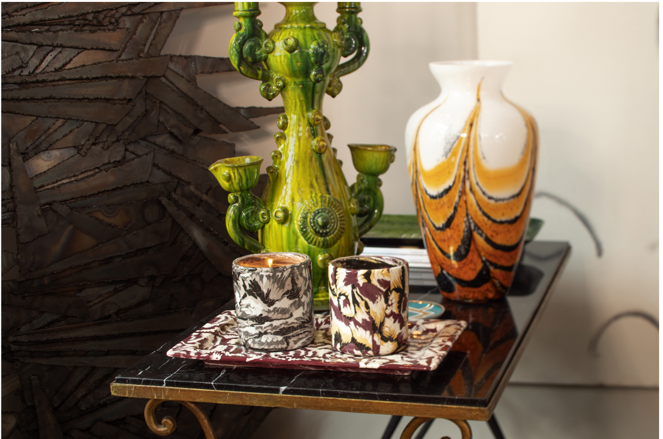
Bougeoir artisanal sicilien, Plateau et contenants à bougies Gilles Dewavrin.