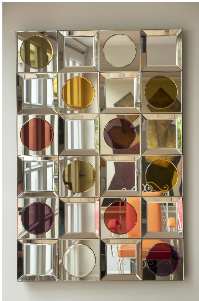
Miroir d'inspiration 60's, de l'artiste Olivier de Schrijver.