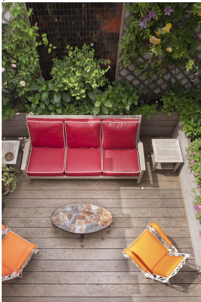
Composition murale avec les carrelages de Dominique Desimpel, table en fer forge chinée à la foire de Deulin en Belgique.

Composée de deux minuscules patios où le maître des lieux écoute pendant des heures le cri des mouettes ainsi que le son des cloches émanant de la maison communale à proximité.