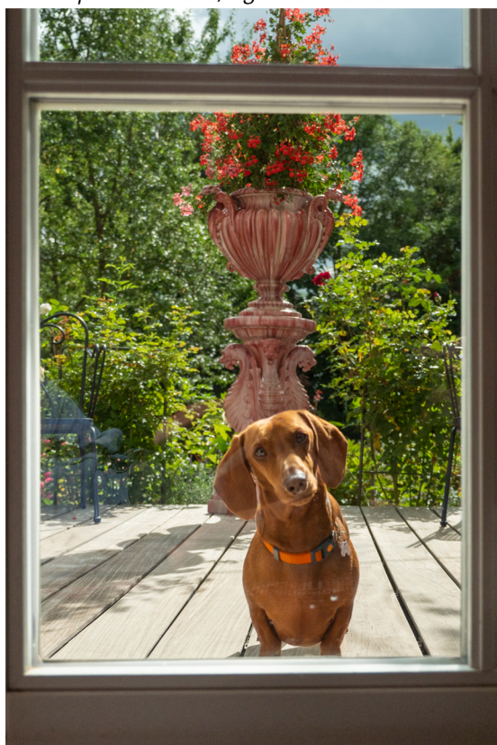
Rudolph le teckel orange et le cache-pot Vallauris rose, signé Massier.