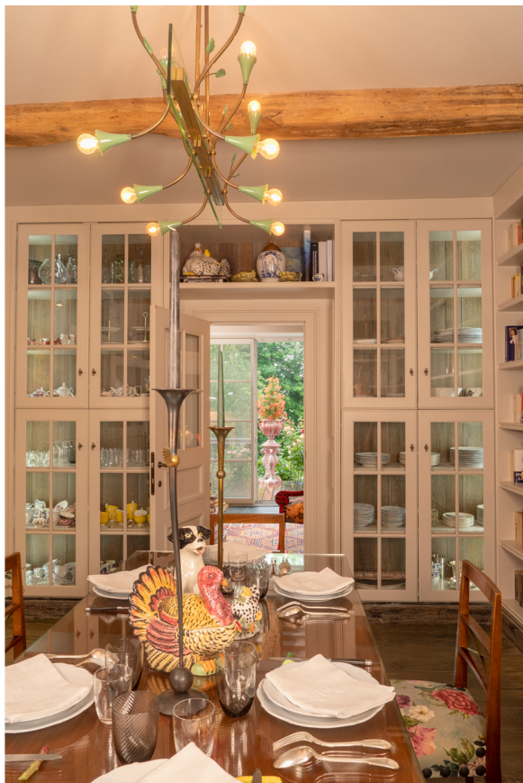
Table et chaises de salle à manger Gio Ponti.

on comprend tout de suite que Gilles se plait à être entouré par une multitude de choses. Les murs sont recouverts de tableaux, de gravures, de vues d'optique et de fixés sous verre. Des meubles vintage italiens, danois et français côtoient ceux qu'il crée, le tout formant un patchwork de couleurs, de matières, qui semble faire bon ménage.