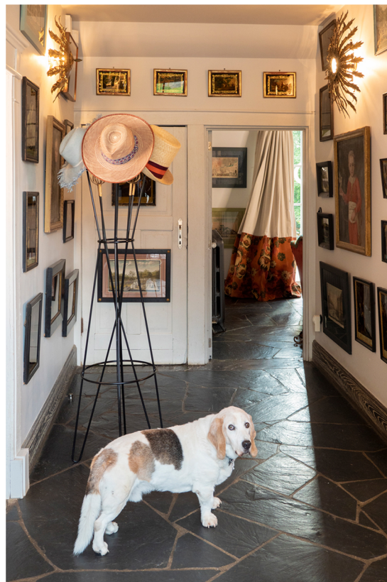
Luca le basset artésien normand.