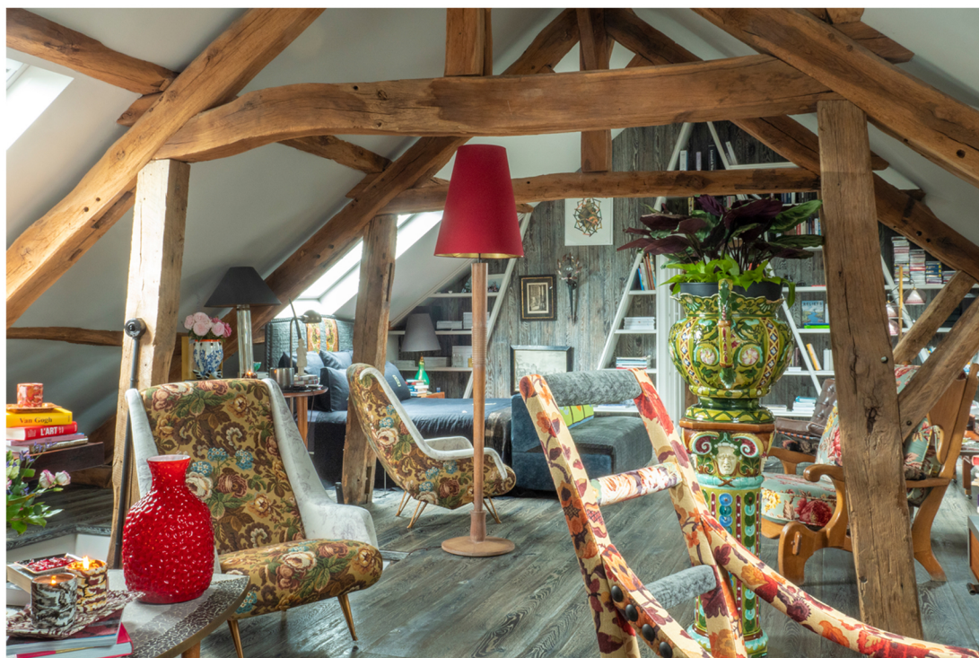
Table basse allemande recouverte de mosaïques. Fauteuil gd.