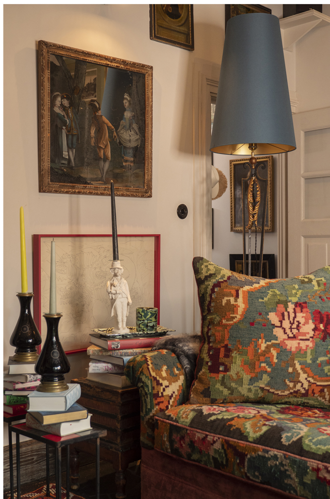
Canapé recouvert d'un kilomètre Moldave. Grand fixé sous verre anglais

LE PENDANT ANGLAIS DE LA FERME, et de son jardin, rappelait au maître des lieux sa jeunesse passée en Angleterre.