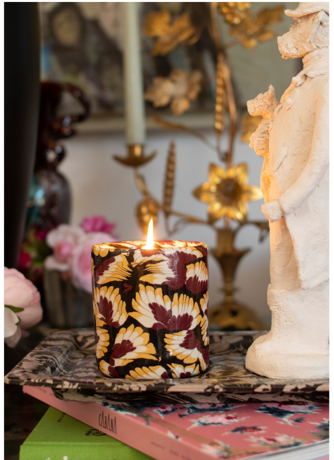
Contenant et cire parfumée, plateau en terres mêlées gd. et bougeoir de Laurence Lenglare.