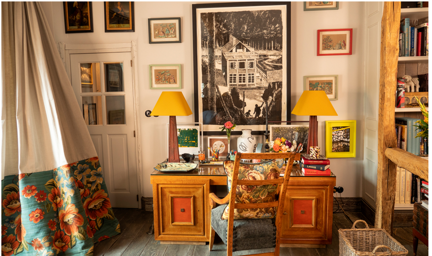
Tableau de Pierre Séinturier.