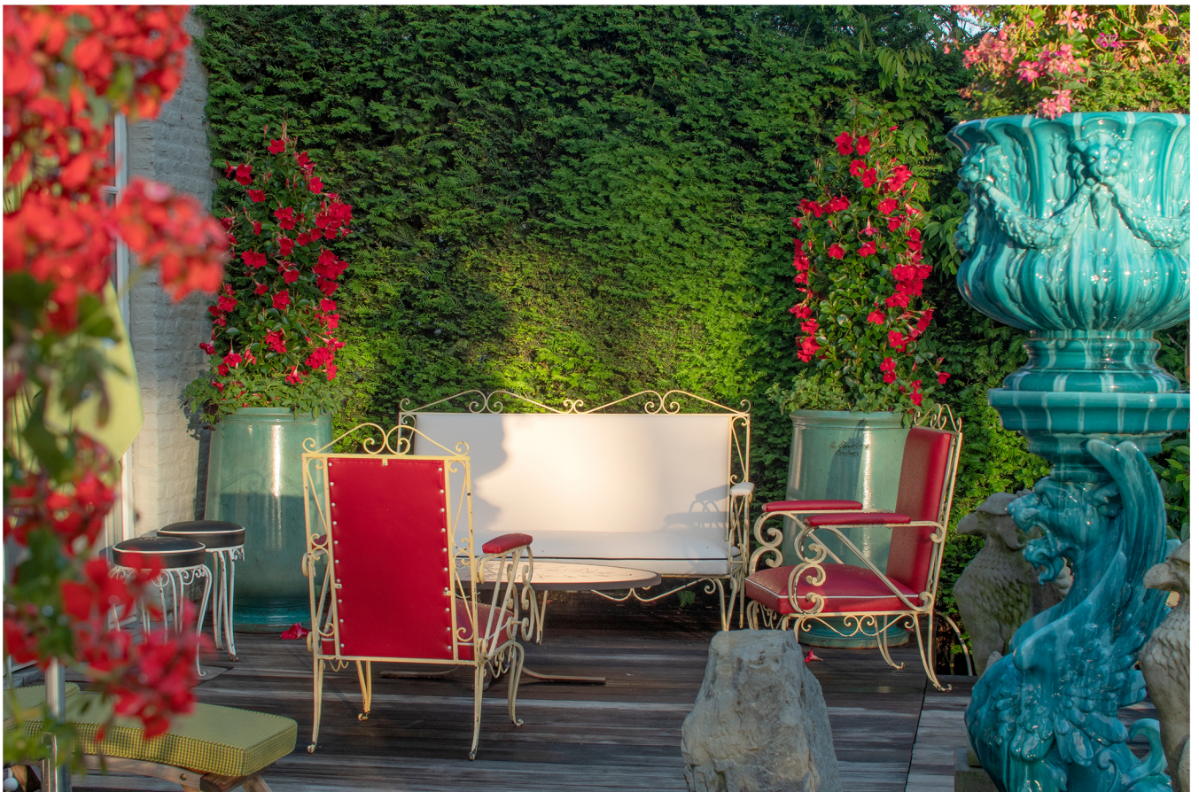
Ambiance "hotel" avec cache pot turquoise Vallauris, signe Massier.