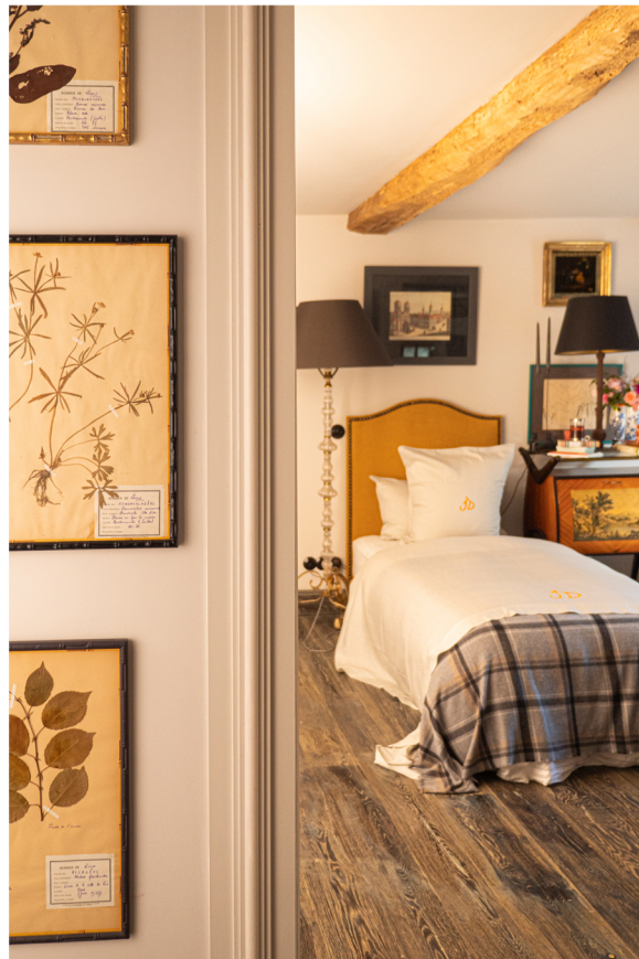
Tête de lit recouverte d'un tissu rubelli.