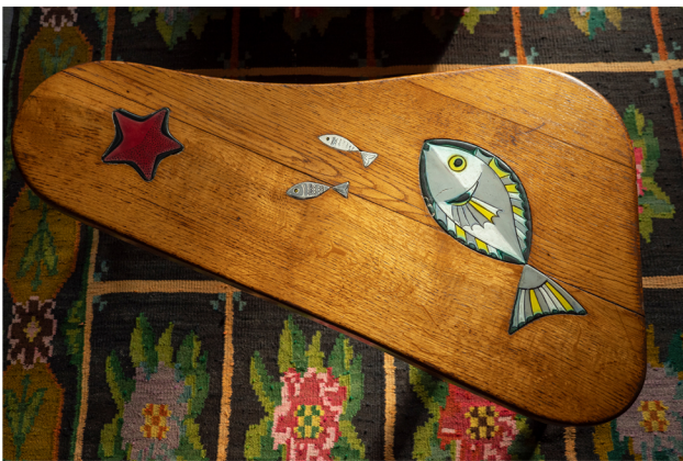
Table basse vintage, en bois, avec incrustation de poissons en céramique.