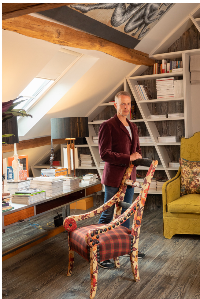
Bureau Jean michel Wilmotte. Lampes vintage américaines. Fauteuil gd.

LE PENDANT ANGLAIS DE LA FERME, et de son jardin, rappelait au maître des lieux sa jeunesse passée en Angleterre.