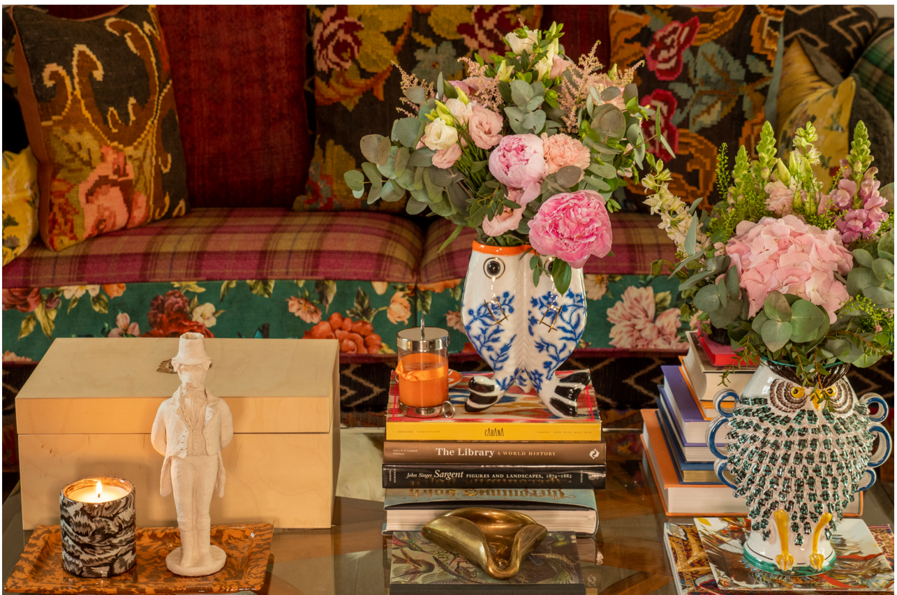
Les fleurs du jardin.