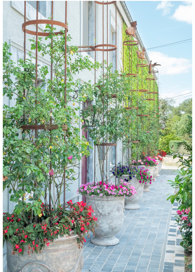
Structures pour rosiers "animaux imaginaires"

Le village, quant à lui, situé en hauteur, convenait parfaitement pour Gilles. On pouvait voir de loin l'ennemi arriver, et par la même occasion échapper aux inondations qui sont fréquentes dans la région.