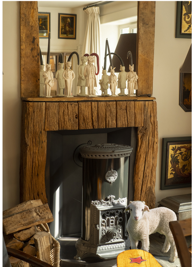
Les bougeoirs de l'artiste Laurence Lenglar, au dessus du poêle Godin.

DES LIVRES sont posés partout, sur les meubles, les étagères, qui donnent le ton pour établir une atmosphère studieuse, chaleureuse ,et pour remplir les longues soirées d'hiver passées au coin du poêle.