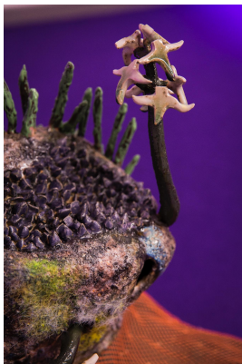
Interconnexion aquatique # naturer de dune, 2022.

Grès pyrite, émaux secrets 1, 2, 3, 5, 9, émaux rouge, émaux bleu, émaux jaune cristal, poils collés électromagnétiquement, 2022